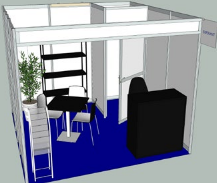
Exemple : stand 9m 2 équipé sans angle